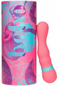
boho Topaz, 139,00 EUR / 169,00 CHF

verwandelt werden. Da bekommt das Wort „Liebesspiel“ gleich eine völlig neue Bedeutung.