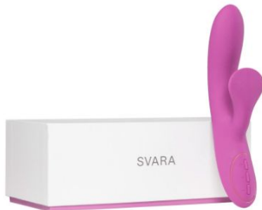
Svara Ledo, 99,90 EUR / 119,00 CHF

Und auch der vielseitig einsetzbare Auflegevibrator YVA (69,90 EUR / 84,90 CHF) schmiegt sich besonders sanft an Klitoris, Schamlippen oder andere äußere Hotspots.