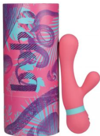
boho Saffron, 139,00 EUR / 169,00 CHF

Klein, aber (b)oho! Wer sich einmal in die neue Luxusmarke verguckt hat, kommt nicht mehr von ihr los. Einst verführt, wie Adam und Eva von der Schlange aus dem Garten Eden, lockt boho mit seinem einzigartigen, spielerischen Design – nicht nur bei den Toys, sondern vor allem bei der stylishen Verpackung, die nicht nur im Schlafzimmer ein echter Hingucker ist!