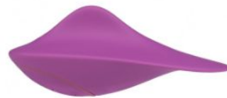
Svara Yva, 69,90 EUR / 84,90 CHF