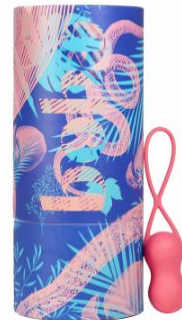
boho Fuchsia, 39,90 EUR / 48,90 CHF

Einzigartig ist auch das Baukastenprinzip der Toys, die das Spielerische der Marke widerspiegelt. So kann der kraftvolle G-Punkt-Vibrator TOPAZ (139,00 EUR / 169,00 CHF) in Kombination mit dem aufladbaren Penisring CYAN (69,90 EUR / 84,90 CHF) im Handumdrehen in einen Rabbit Vibrator