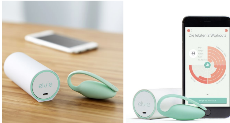
Chiaro Elvie, 199,00 EUR / CHF

Sonoma Internet GmbH, Wattstraße 11, 13355 Berlin