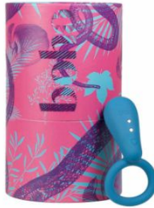
boho Cyan, 69,90 EUR / 84,90 CHF