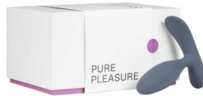
Svara Fylla, 34,90 EUR / 39,90 CHF

Sonoma Internet GmbH, Wattstraße 11, 13355 Berlin