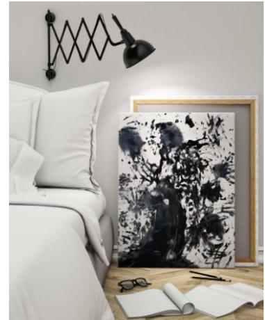
AMORELIE Lovers Art Box , 79,00 EUR / 99,00 CHF